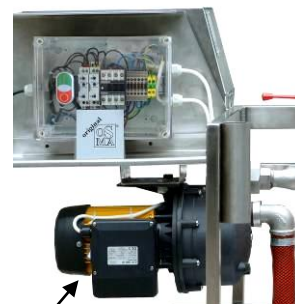
Sug- och tryckpump