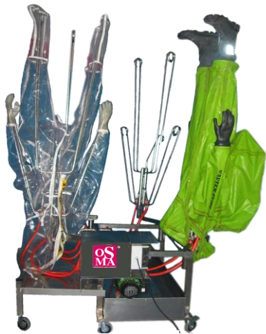
HT 304- A f

HT 302-A (för 2 kemskyddsdräkter) HT 303-A (för max 3 kemskyddsdräkter) HT 304-A (för max 4 kemskyddsdräkter)